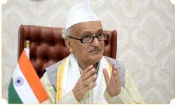
राज्यपाल तथा कुलपती श्री. भगतसिंह कोश्यारी मार्गदर्शन करतांना